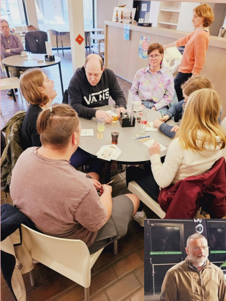
Bar Biezoender Bingo