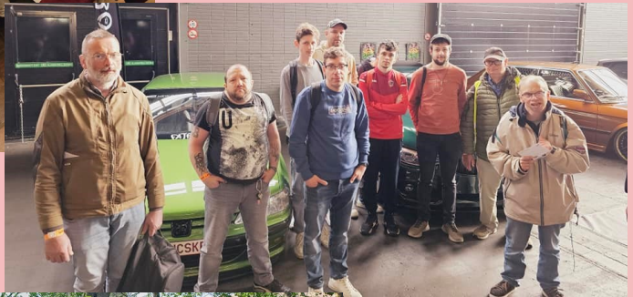
GR 8 in Kortrijk Expo